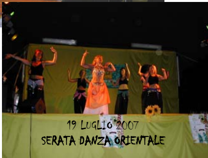
19 LUGLIO 2007 SERATA DANZA ORIENTALE