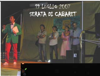
19 LUGLIO 2007 SERATA DI CABARET