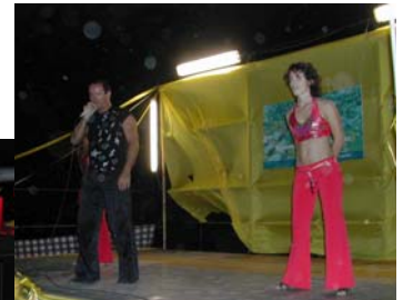
21 LUGLIO 2007 SERATA LATINO AMERICANA