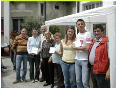
PODIO GARA A COPPIE