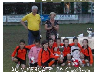
AC VIMERCATE 2ª Classificata