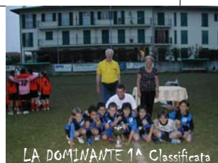
LA DOMINANTE 1ª Classificata